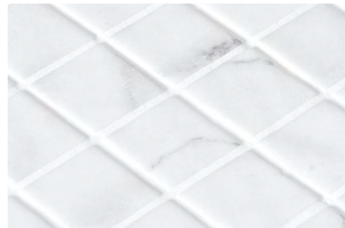
Ecostones – C3 / R11