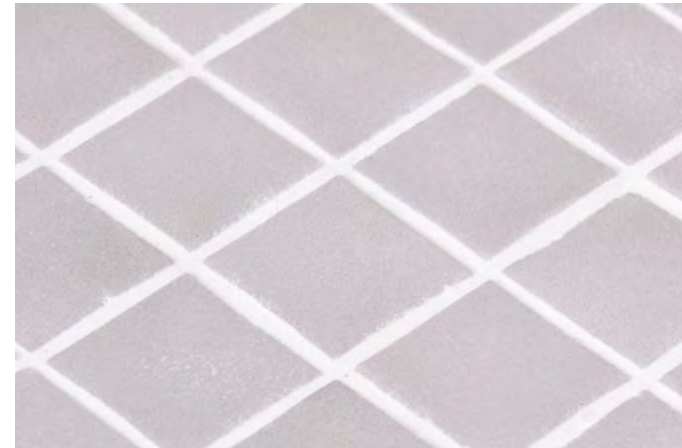
Stoneglass – Mohs 9